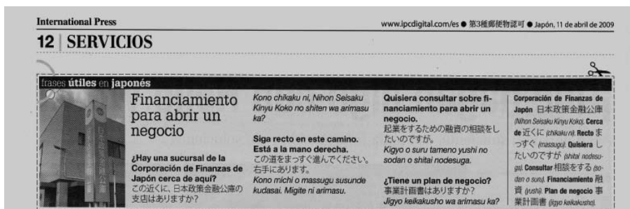
インターナショナルプレス 783号 (2009年4月11日) 12面

つまり、これまで人から聞くなどして漠然とした知識は持っていたものの、仕事が忙しくて役所に行く時間がない、あるいは日本語がよくわからないので手続きをしないまま放置していた、というタイプの事柄である。失業して時間ができ、生活費にも事欠く状況であれば、とにかく行ってみようというモチベーションを与えるための情報提供であるともいえる。おおむね実践的な会話を平易な漢字を用いて表しているが、「救急車を呼ぶ」「薬局で」「外国人登録証の紛失」「団地の申し込み」など、状況が切迫していると思われるもの、重要度が高いものについてはすべてひらがなで表記されている。はさみのイラストと点線で切り取って保存できることを示しているのも、その切抜きを見せれば訪問先の日本人が持参者の意図を理解する助けとなると思われる。